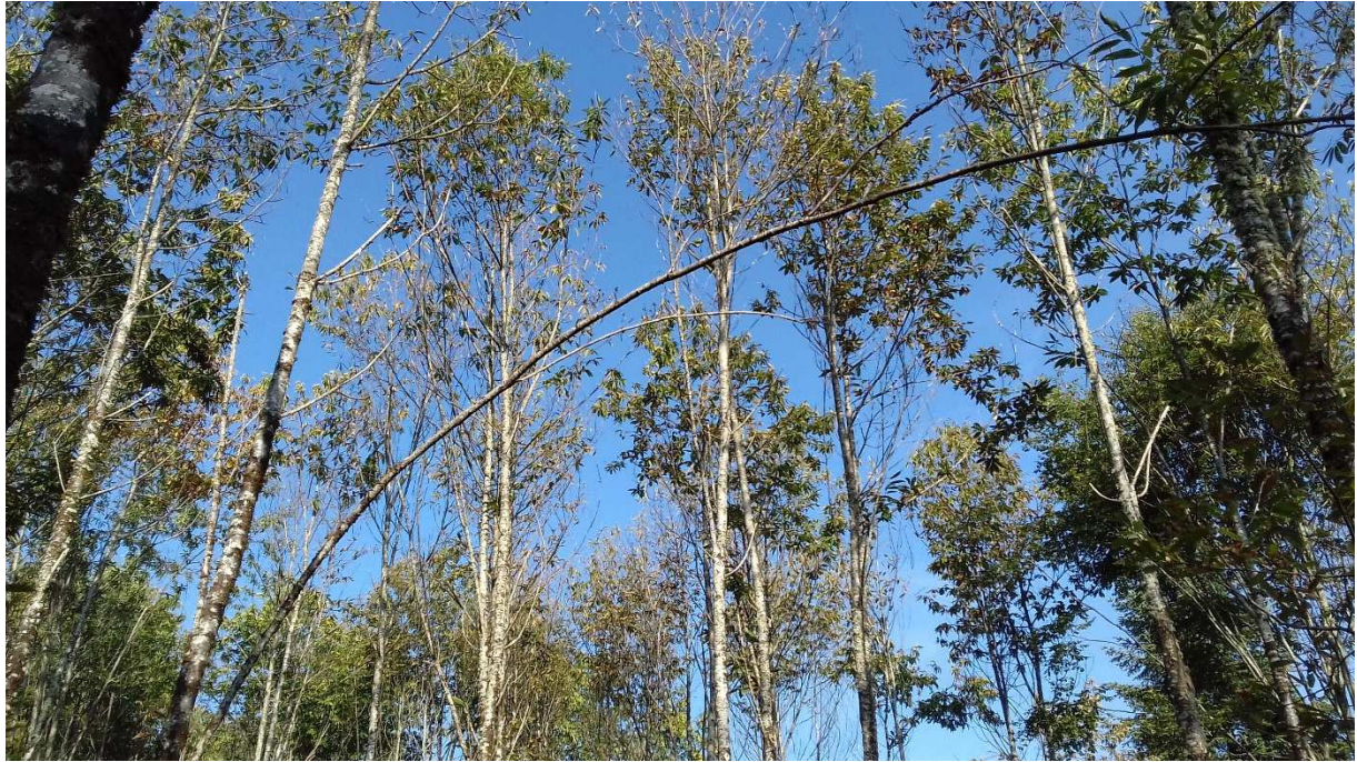
Été 2020 : houppiers de châtaigniers après 2 ans de balivage, parcelle A 0589 à Cussac (17/09/2020)

Quelles actions particulières avez-vous mis en œuvre pour valoriser les co-bénéfices que vous avez déclarés à l'année de labellisation de votre projet ( ne renseigner que si pertinent* ) ?