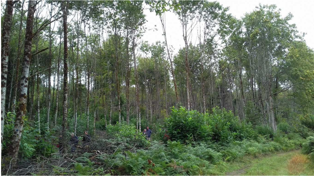
Automne 2019 : châtaigniers après 1 an de balivage, parcelle A 0589 à Cussac (27/09/2019)