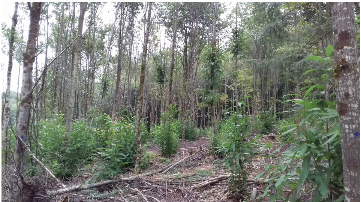
Automne 2019 : châtaigniers après 1 an de balivage, parcelle A 0589 à Cussac (27/09/2019)