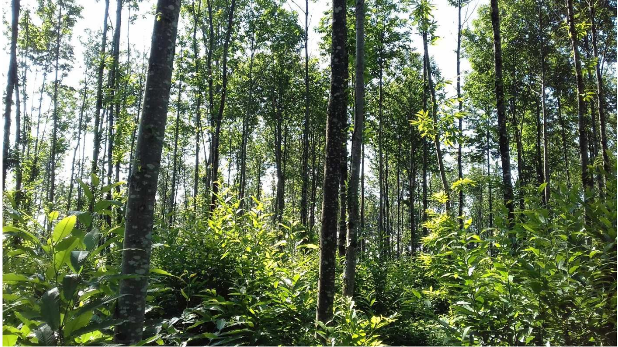
Été 2018 : châtaigniers après 2 ans de balivage, parcelle ZA 0084 à Bussière-Galant (03/07/2018)

Insérer ci-après des photographies légendées du projet à des âges différents à joindre.