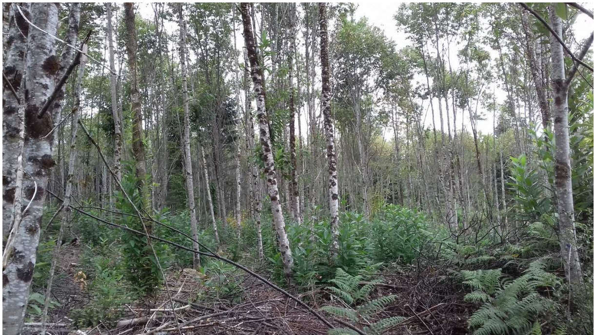
Automne 2019 : châtaigniers après 1 an de balivage, parcelle A 0589 à Cussac (27/09/2019)